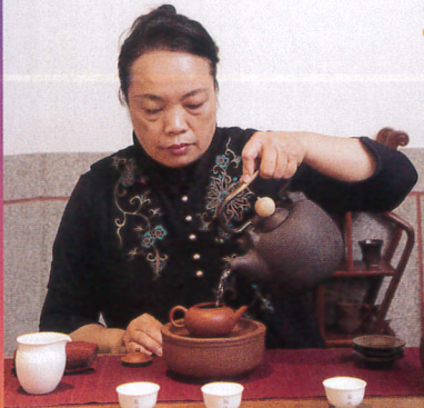
教えるからやってみてね