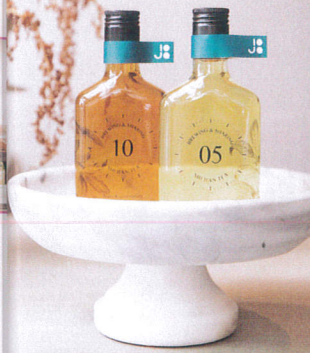
1 左から暮梅老葉(ヘビーステッドウーロン)、烏龍午韻(ライトローステッドウーロン)各95元。アイ스티ーはお店で丁寧に水出ししている