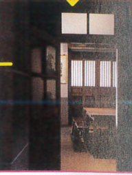
奥には素敵なお茶室が、心静かにお茶できる