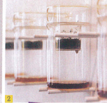
2 OTHER SHOT