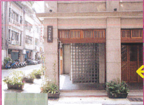
1 建物の風情へ、ガラス部分は5年前に加えられた